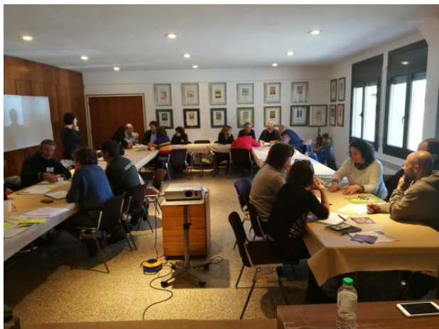
Jornada d'Alp. Treball en petits grups