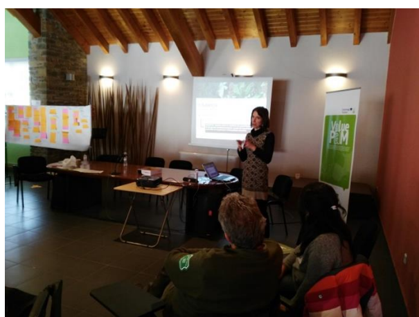
Jornada de Sort. Presentació de la dinàmica