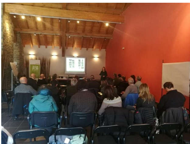
Jornada de Sort. Moment de les ponències