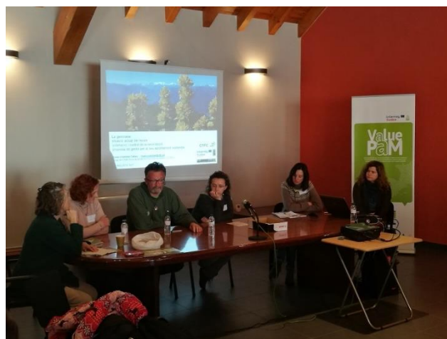
Jornada de Sort. Taula rodona d'experiències