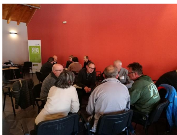
Jornada de Sort. Dinàmica participativa. Treball en petits grups