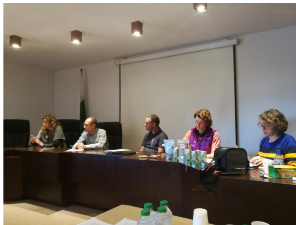
Jornada d'Alp. Taula rodona