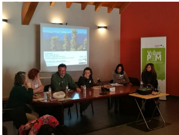
Taula rodona d'experiències