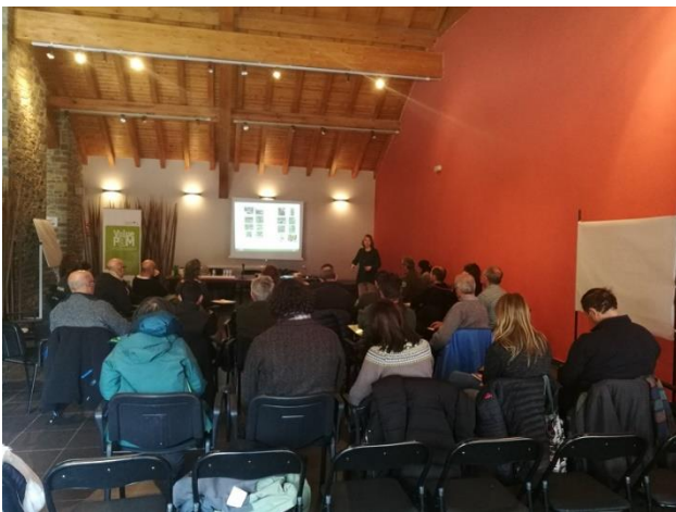
Moment de les ponències