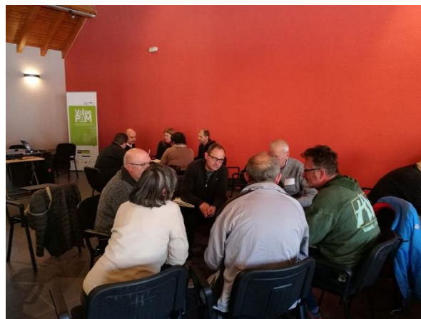
Dinàmica participativa. Treball en petits grups